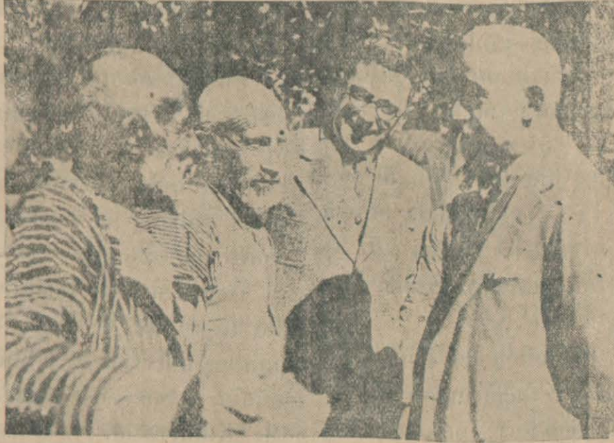
Başvekil Hazretleri bir Seyahat Esnasında

Başvekil Hz. Şark Vilâyetlerinde onbeş gün seyahet edecekler kendilerine Dahiliye Vekili ve bir çok Mebuslar refakat ediyor