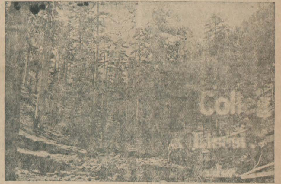
Tahrip Edilen Ormanlardan bir Görünüş

Proianın muhabiri kitabın Bulgar matbuat bürosu tarafından muhtelif ecnebi gazete muhabirlerine tevzi edilmiş olduğunu bilhassa kaydettikten sonra mezkûr matbuat bürosu memurlarından Assen Bozinof'un neşrettiği diğer bir kitaptan da bahsediyordu. Bu kitapta ezcümle Türkiyenin Bulgaristandaki Türk ekalliyetine mukabil Trakya'yı Bulgaristan'a devretmesi lâzım geleceği ileri sürülmektedir.